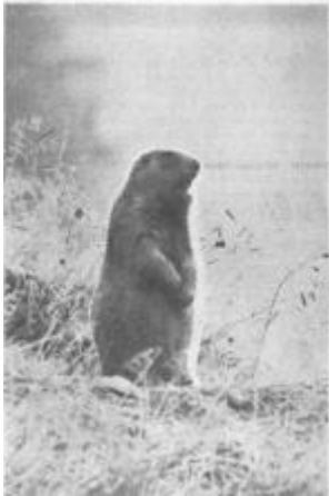
Ein Gewratschki