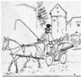
Die Konkurrenz mit schwarzem Zylinder

Hatte ein Gast auf einem feuchtföhlichen Ausflug des Guten zu viel getan, so konnte er, wenn auch nicht gerade mit der „Grünen Minna“, so doch mit der „Porzellanfuhrer“ heimkehren, diesem schon recht wackligen Gefährt der Droschkenkutscher. Die Mährenlenker waren mit einer gehörigen Portion Mutterwitz ausgestattet und repräsentierten allein durch ihre Existenz ein Stück Königsberger Stadtgeschichte. Einst hatte es zwei Sorten von Droschkenkutschern gegeben: solche mit weißlackiertem, schwarzbebandertem Blechzylinder auf dem Kopf, und die schließlich obsiegende Konkurrenz mit schwarzem Zylinder und weißem Band. Aber der technische Fortschritt in Gestalt der Autodroschken hatte sie allmählich fast völlig verdrängt.