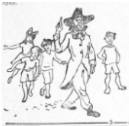
Das war der Planeten-August ein verbummelter Oberlehrer . . .

Auf der Straße begegnete man mitunter auffallenden Erscheinungen. Da war der „ Planeten-August “, ein verbummelter Oberlehrer, der vor einem belustigten Publikum seine kunterbunten, mit lateinischen und griechischen Vokabeln gewürzten Reden hielt und einen Rattenschwanz johlender Kinder hinter sich herzog.